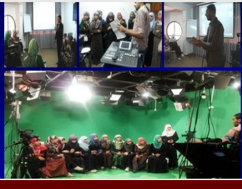
قسم الصحافة والإعلام يختتم برنامجاً تدريبياً للطلبة في الإعداد والتقديم

نشرة بريدية تصدير فصلياً عن كلية الآداب بالجامعة الإسلامية - غزة | الفصل الدراسي الأول للعام الجامعي ٢٠١٣/٢٠١٤