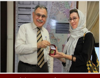
رئيس الجامعة يستقبل وفداً من مراسلون بلا حدود لحرية الإعلام

تابعونا أيضاً على صفحات التواصل الاجتماعي: