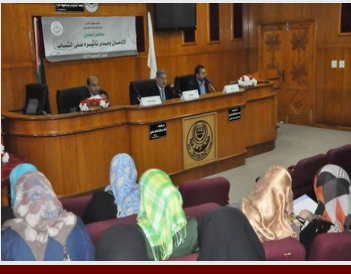
قسم الخدمة الاجتماعية ينظم محاضرة حول الإدمان ومدى تأثيره على الشباب