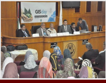
يوماً دراسياً بمناسبة اليوم العالمي لنظم المعلومات الجغرافية