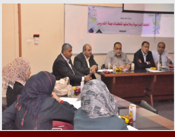
ورشة عمل الخطط الدراسية وملائمتها لمتطلبات مهنة التدريس