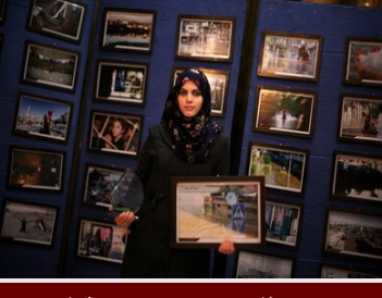
جائزة أفضل صورة صحفية في مسابقة "الوفاء للصحفي الفلسطيني"